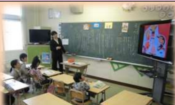
ICT機器を活用したわかりやすい授業