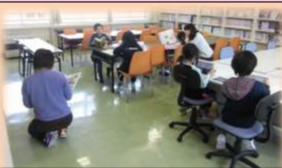
学習意欲に溢れるアクティブな調べ学習