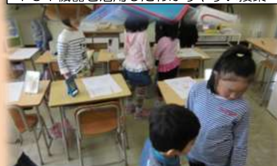
互いに作品を見合うなど, 動きのある授業