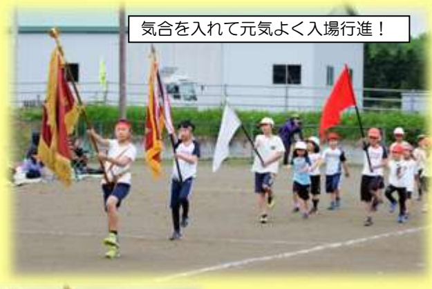
気合を入れて元気よく入場行進！

特に1年生は初めてのことばかりで、練習の最初は全然できなかったことが、本番ではあのように立派にできるようになりました。2年生以上も、昨年以上に成長した姿をお見せできたのではないかと思います。保育所の子どもたちも可愛らしく走ったり跳ったりする姿を見せてくれました。