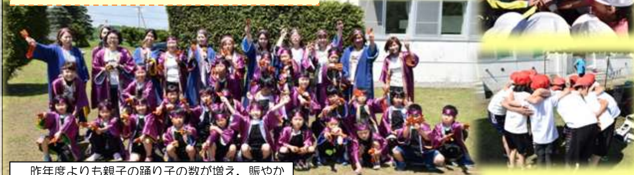
昨年度よりも親子の踊り子の数が増え、賑やかに踊ることができました。～とべっ子よさこい～