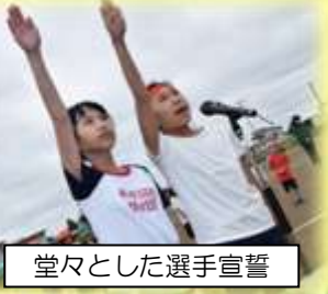
堂々とした選手宣誓