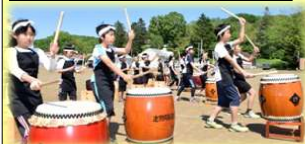
豆太鼓の1年生が増えましたが、全員の音が少しずつ揃ってきました。～途別百年太鼓～

大運動会前日、保護者の方々が進んでグラウンドに砂を入れたり、テントを組み立てたりしてくださいました。青年団の方々が当日の道具係などに積極的に取り組んでくださいました。老人会の方々が多数ご参加くださり、大運動会を盛り上げてくださいました。お陰様で地域が一体となり、盛会裏に終えることができました。