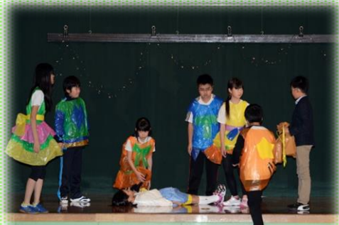
高学年の迫真の演技「ユートピア学園」