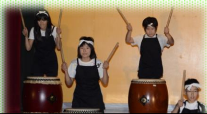
運動会より磨きのかかった百年太鼓