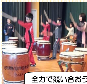
全力で競い合おう