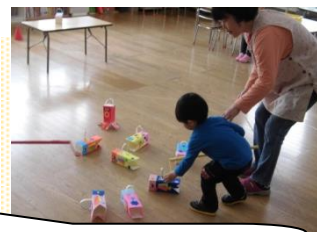
保育所でもがんばってます