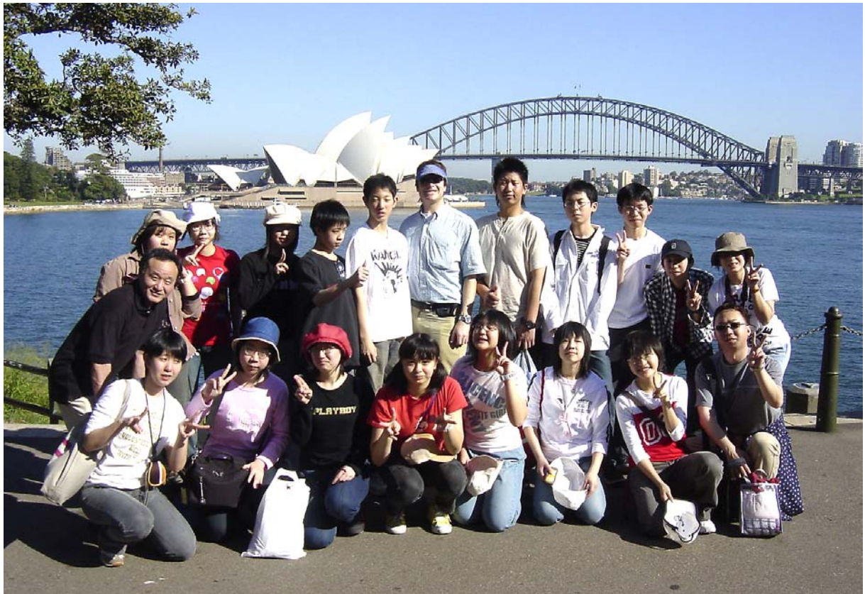
▶オペラハウスをバックに撮影(シドニー市)

事前研修は、ホームステイを想像させ、実感を湧かせてくれた。実際に経験し、次はもっとたくさんの人々と英語に触れたいと思うようになりました。