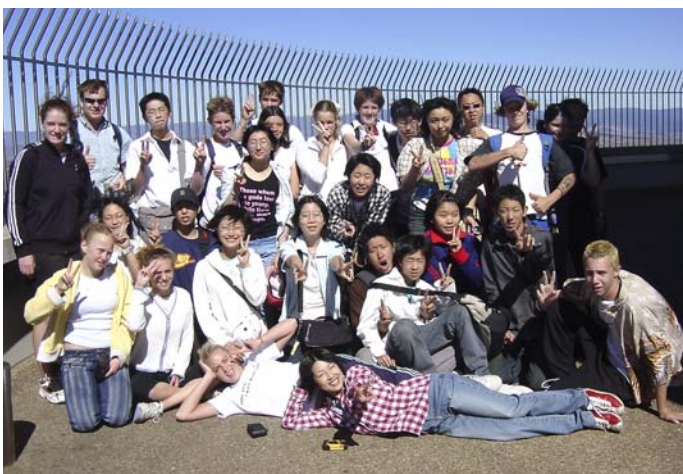
◀ホストバディとテルストラタワーにて(キャンベラ市)